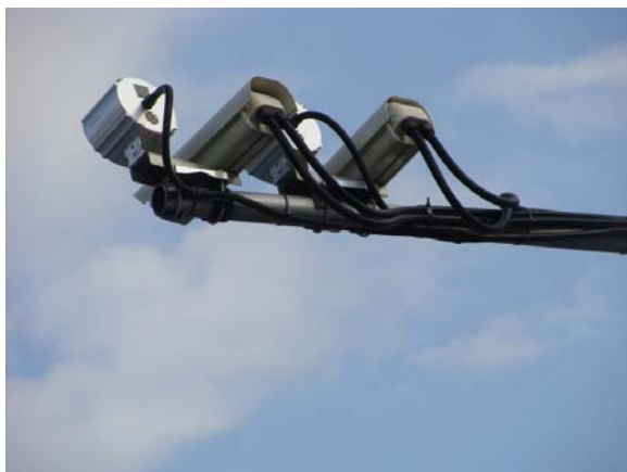
Фиг. 1. Камери за наблюдение на регистрационни номера на автомобили от система REGIX , вариант REGIX-C