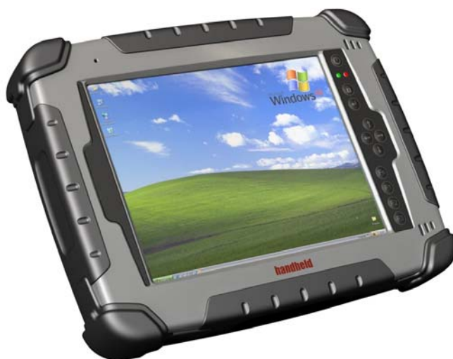
Фиг. 3. Преносим компютър, подходящ за работа при тежки условия в мобилен вариант